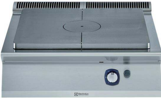
371007 (E7STGH1000) 燃气 热板炉 台面 800毫米

项目# _____ 型号# _____ 名称# _____ SIS # _____ _____